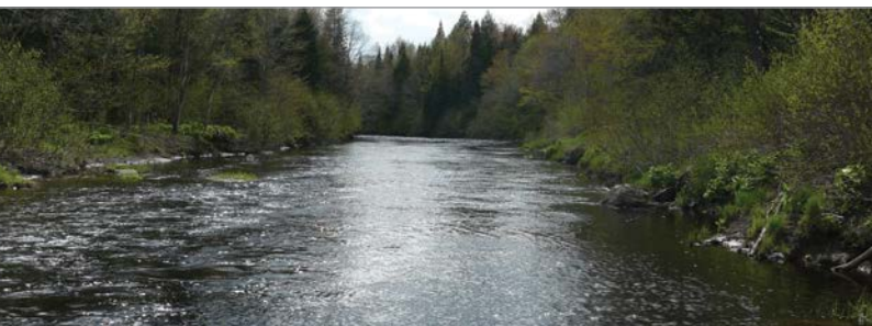
La rivière Noire sillonne le territoire sur une distance de 45 km.