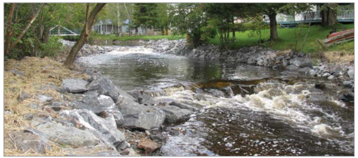
Projet de compensation dans l'habitat du poisson de la rivière Noire

http://www.fondationdelafaune.qc.ca/initiatives/foret_privée/