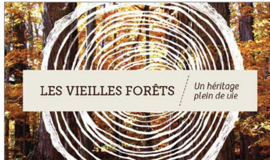
Brochure Les vieilles forêts, un héritage plein de vie .