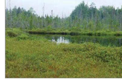
Plus de 65 ha de milieux humides ont été conservés de manière volontaire.