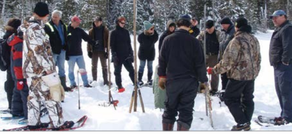
Une activité de formation sur la gestion du castor s'est tenue à l'intention des acteurs locaux.