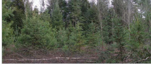
Des travaux fauniques ont permis de rejoindre un plus grand nombre de propriétaires.